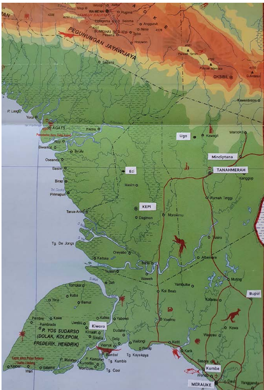
Landkaart van zuid-Papoea met daarop aangegeven waar onze projecten zijn.

NL90 RABO 0106 8937 93 t.n.v. Stichting Papoeajeugd naar school. Platanenlaan 36, 3911 PC Rhenen. RISN of fiscaal nummer: 8103.66.046. KvK nummer : 41096770