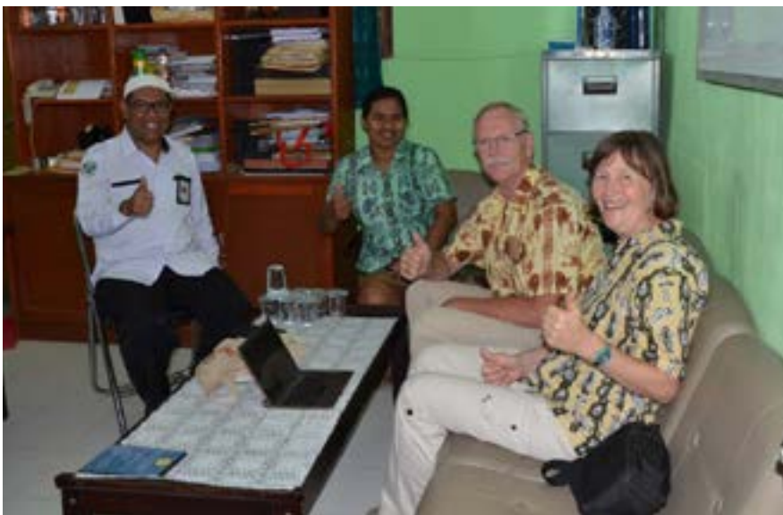
Bezoek aan de AKPER met links het hoofd van de school.