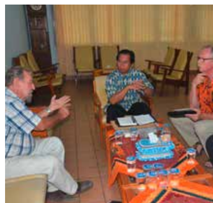
Overleg met de bisschop

Op deze school worden al een aantal kinderen geholpen via project 50.