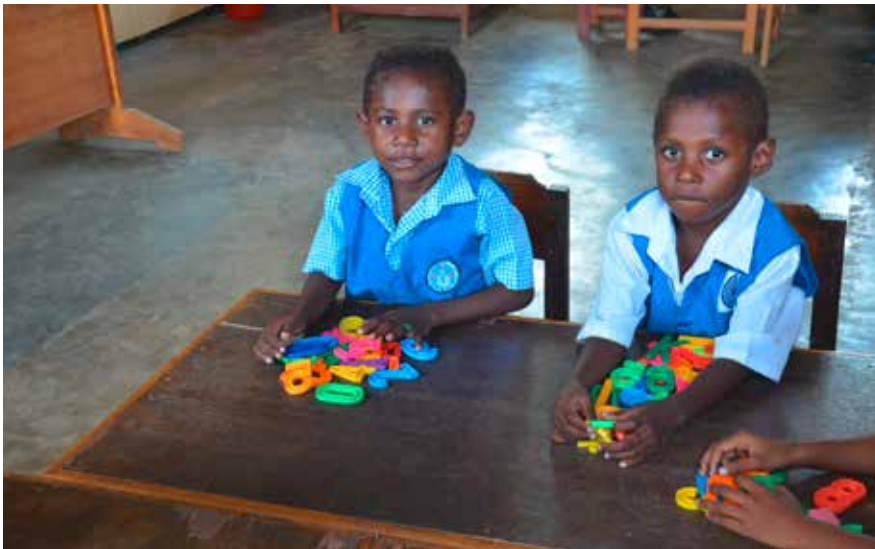
Jong geleerd, oud gedaan!

Voor de tweede helft van het schooljaar 2016-2017 worden 1230 kinderen ondersteund bij het betalen van schoolgeld, uniformen e.d. Alle scholen en internaten hebben goede verslagen ingeleverd over het eerste half jaar (MRK = Merauke):